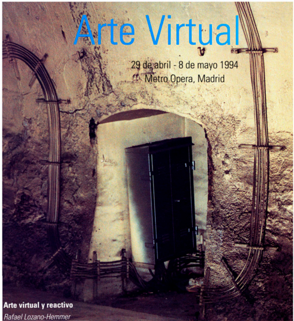
Arte virtual y reactivo Rafael Lozano-Hemmer

29 de abril - 8 de mayo 1994 Metro Opera, Madrid