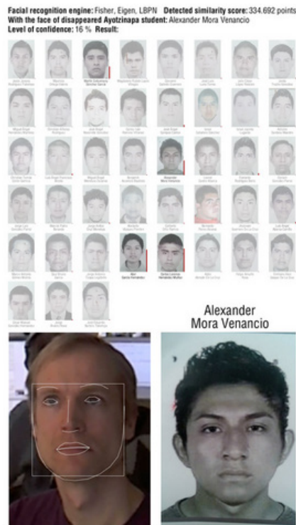
Rafael Lozano-Hemmer, Nivel de confianza (2015). ©Antimodular Research. Cortesía del artista

Es este contexto se encuentra su último proyecto. A seis meses de la tragedia ocurrida en Ayotzinapa, Guerrero, el pasado 26 de marzo el artista dio a conocer la pieza Nivel de confianza (2015) que muestra el rostro de los 43 estudiantes de la Escuela Normal Rural "Raúl Isidro Vargas" que, hasta el momento, continúan desaparecidos. Aunque los retratos no han dejado de circular de forma mediática, se tratan de imágenes que no se agotan: "Por más que los gobernantes, periodistas y empresarios pidan «superar lo de Ayotzinapa», y mientras no existan pruebas científicas que avalen la versión oficial, es crucial continuar con la búsqueda, por solidaridad humana, seriedad institucional y coherencia ética," señala Lozano-Hemmer en entrevista con Código .