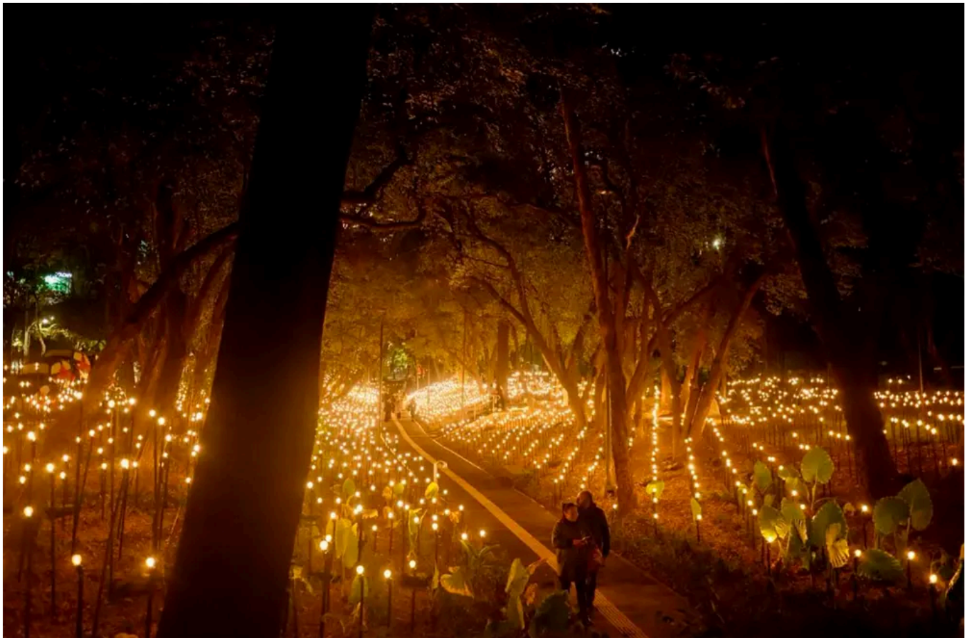
“Rafael Lozano-Hemmer: Jardín Inconcluso”, en el MAM.Especial