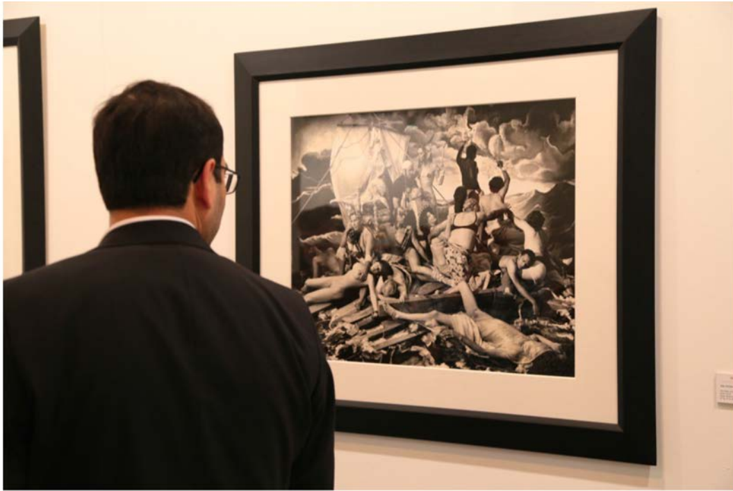
Joel-Peter Witkin.