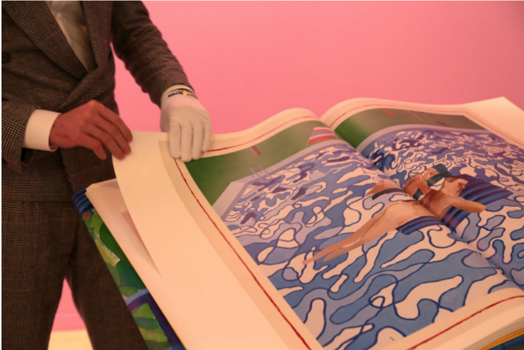
El libro gigante del stand de TASCHEN.

Aunque no es exactamente una obra, no hemos podido evitar pararnos ante el libro XXL dedicado a Hockney en el stand de TASCHEN.