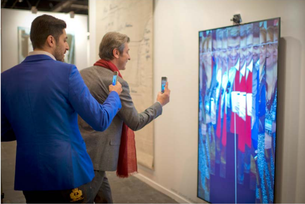
Rafael Lozano Hemmer.

En todas las ediciones hay piezas que consiguen gran atención mediática, hoy nos ha parecido que eso ocurría con la estupenda obra del artista Juan Hidalgo, Premio Nacional de artes plásticas, en ADORA CALVO. También con el vídeo interactivo de Rafael Lozano Hemmer en la pared exterior de MAX ESTRELLA.