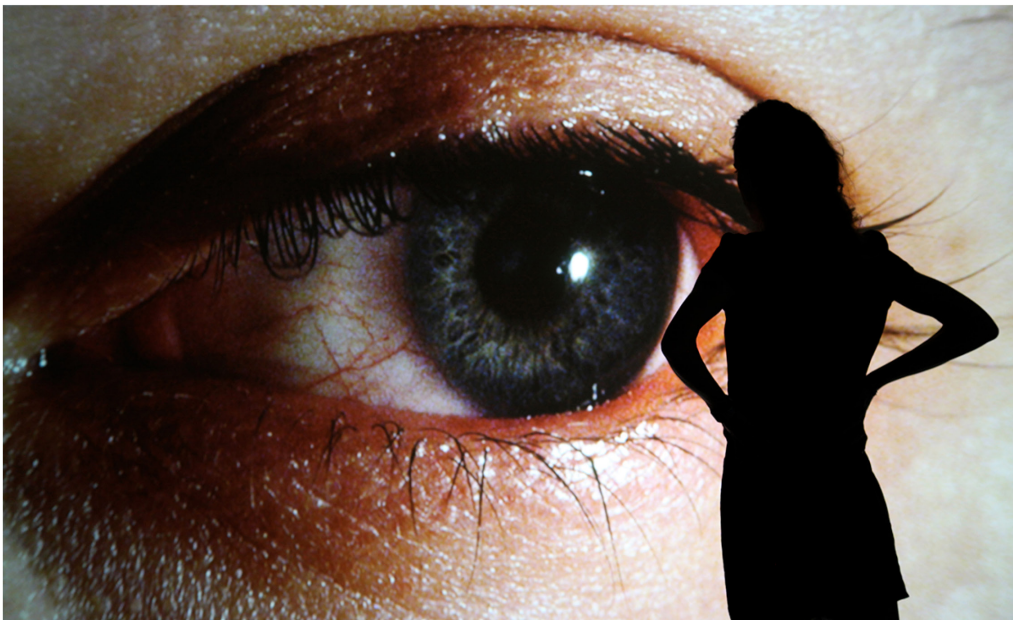
Rafael Lozano-Hemmer, "Surface Tension", 2007. "Trackers", La Gaité Lyrique, Paris, 2011.

El título de la exposición es una referencia a los automatismos surrealistas, una práctica artística que apostaba al poder creativo del subconsciente y se sostenía sobre la noción de valor en lo accidental y lo aleatorio. Lozano Hemmer amplía esta noción planteando la imposibilidad de lo aleatorio en el universo maquínico, en donde cualquier pretensión de autonomía en un programa es tan solo una simulación. En palabras del artista, un pseudomatismo intenta hacer tangibles las predeterminaciones inherentes a esas simulaciones. Por definición el pseudomatismo es una acción casi-voluntaria: si el autómeta actúa 'por sí mismo', la obra de Lozano-Hemmer al contrario busca actuar "en relación".