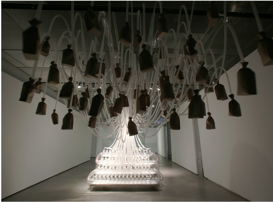
Rafael Lozano-Hemmer, Respiración Circular Viciosa , 2013.

La muestra cuenta con cinco estrenos mundiales en varias escalas, desde Pabellón de Ampliaciones , una enorme proyección realizada en colaboración con el artista polaco Krzysztof Wodiczko, hasta Nanopanfletos de Babbage , pequeños folletos de oro que fueron impresos en el Nano Scale Facility de la Universidad de Cornell.