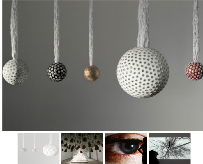
© Rafael Lozano-Hemmer. Tensión Superficial, 1992.

Rafael Lozano-Hemmer es uno de los artistas contemporáneos más reconocidos en todo el mundo. Desarrolla instalaciones interactivas que combinan la tecnología , la arquitectura y el performance . Su interés se enfoca en problemáticas sociales y la interacción de las personas como el elemento que activa y da sentido a su obra.