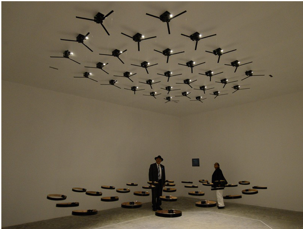
Pseudomatismos de Rafael Lozano-Hemmer. MUAC, 2015