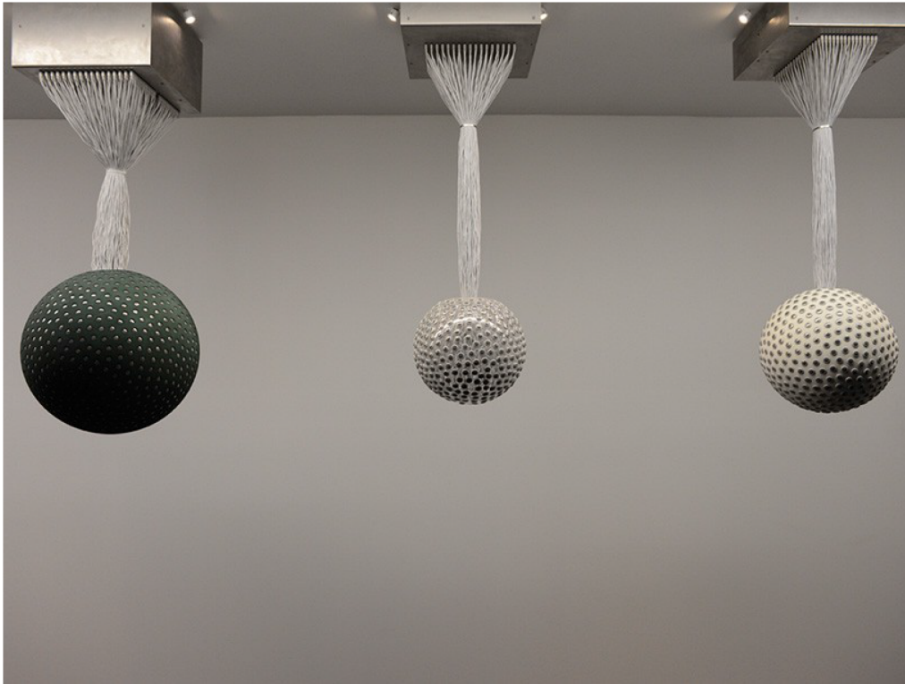
Pseudomatismos , 2014 Imagen: David González