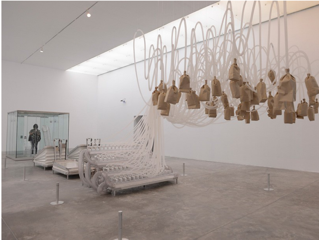
Pseudomatismos , 2015