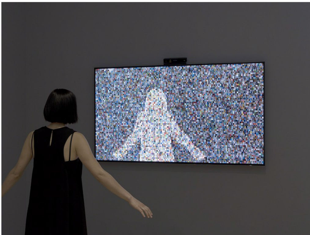
1984 x 1984 , 2014 Imagen: cortesía Rafael Lozano-Hemmer