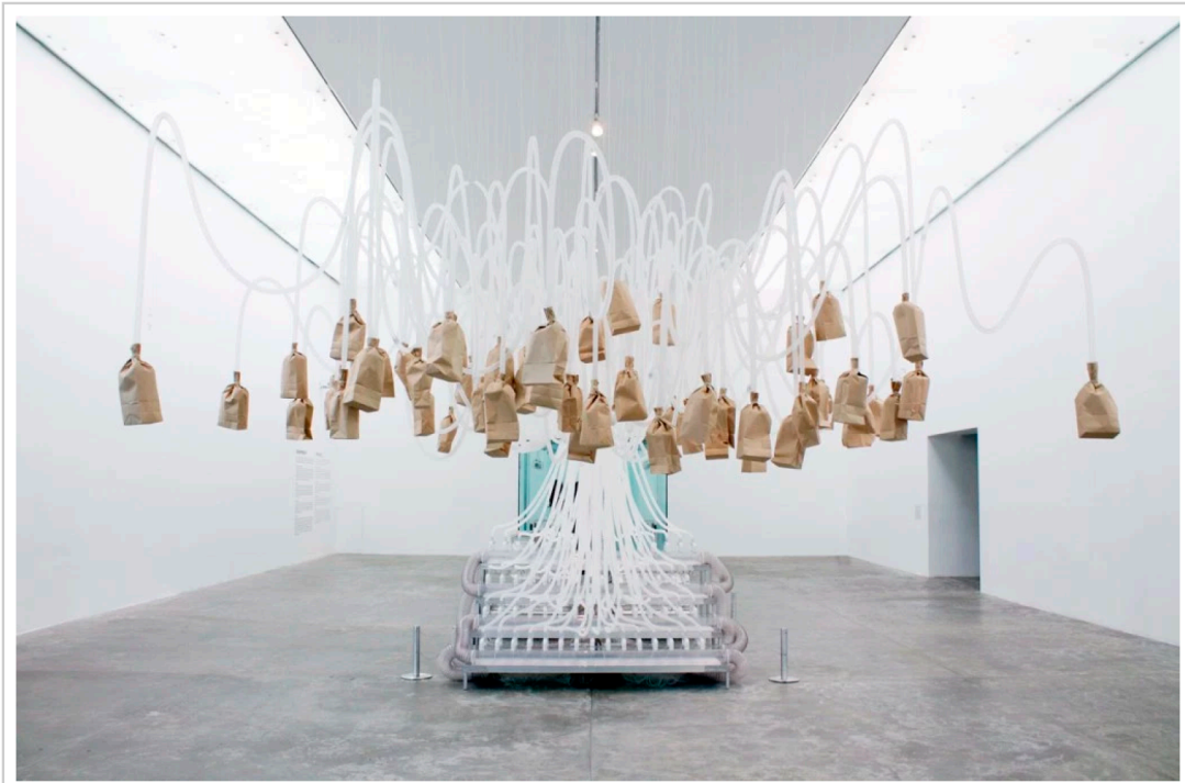
Respiración circular y viciosa, 2013. 61 bolsas de papel, circuitos electrónicos, tubos de respiración, sensores, computadora, programación en OpenFrameworks y Wiring.

La primera sala del recorrido de la exposición alberga la instalación, Respiración circular y viciosa , un aparato cerrado en forma hermética que permite al público inhalar el mismo aire previamente respirado por los visitantes anteriores. Este intercambio de oxígeno confronta la idea del espacio público y el espacio privado. En cierto punto, el aire que se encuentra en rotación dentro de este aparato mediante el uso de las bolsas de papel entra a los pulmones del usuario y dentro de su cuerpo se mantiene privado cuando lo exhala regresa a ser público.