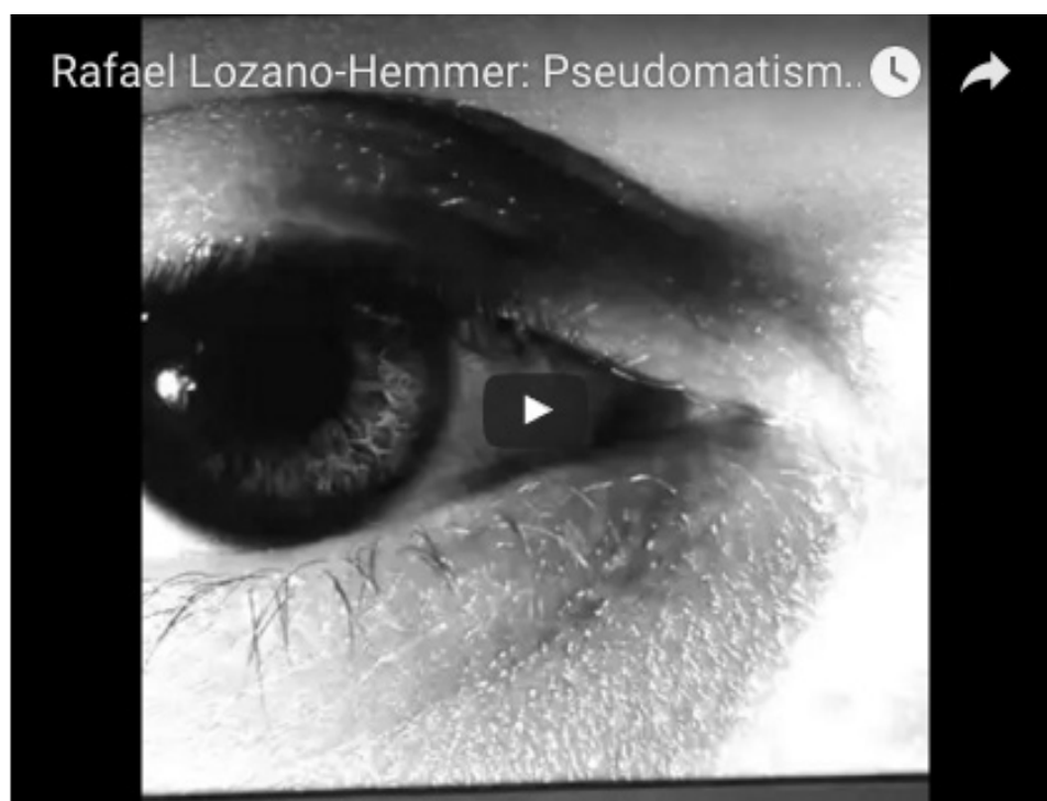
Tensión superficial, 1992. Sistema de vigilancia computarizada, pantalla, programación en Delphi.