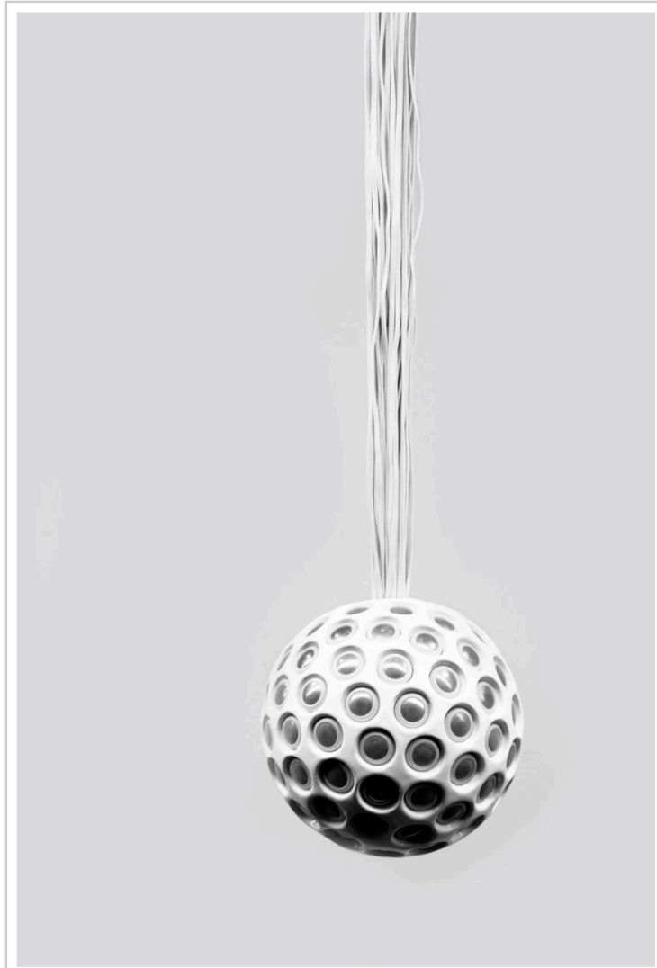
Empaquetamiento de esferas, 2013-2015. Impresiones 3D en diversos materiales, miles de canales de sonido, acero inoxidable, tarjetas electrónicas, arduino, programación en Grasshopper, Wiring y C.

Siguiendo el recorrido de la exposición se encuentra un pantalla que muestra un ojo que sigue al espectador mediante un sistema de vigilancia computarizada. Esta pieza fue inspirada por la lectura del texto de Georges Bataille "El año solar", durante la primera Guerra del Golfo, en la que se presencié el primer despliegue generalizado de "bombas inteligentes" guiadas por cámaras. La interacción se vuelve una parte esencial en esta exposición, sin la interacción del público la obra pierde el sentido.