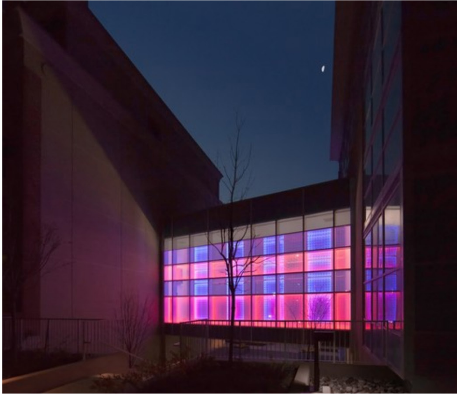
Erwin Redl, Sky Bridge Patterns, West Bridge view

Borusan Contemporary'nin geniş koleksiyonundan seçilen önemli eserlerden oluşan Segment #4 sergisinde ise Jesse Fleming, Ali Ömer Kazma, Erwin Redl, Paul Schwer gibi sanatçıların eserleri bulunuyor.