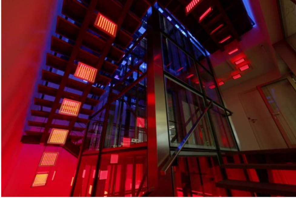
Erwin Redl, 'Meandering'

Avusturyalı sanatçı Erwin Redl 'in Borusan Contemporary için özel olarak tasarladığı, led ışık panelleriyle 8 kat merdiven boşluğunu kaplayan ' Meandering ' adlı enstalasyonu da sanatseverlerin beğenisine sunulacak.