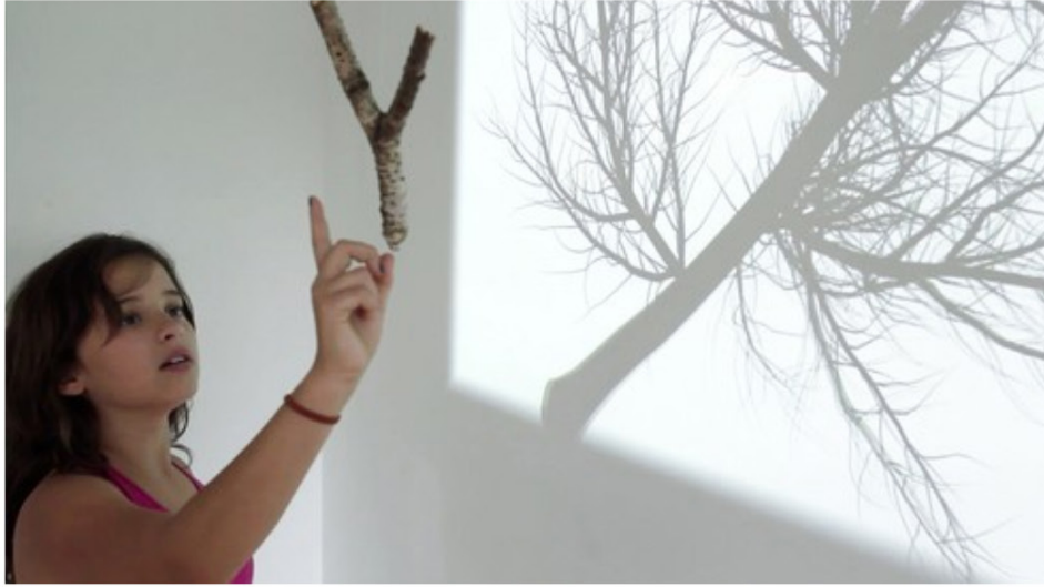
Rafael Lozano-Hemmer, Bifurcation, 2012

Sanatçının, yaşamsal öğeler aracılığıyla duygusal ve kişisel çağrışımlar yapmayı hedefleyen eserlerinden oluşan ' Vicious Circular Breathing ' ve Borusan Çağdaş Sanat Koleksiyonu'ndan bir seçkiden oluşan Segment #4 , Perili Köşk'te görülebilecek.