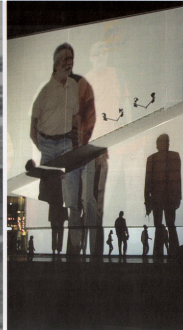
Body Movies, Arquitectura Relacional 6