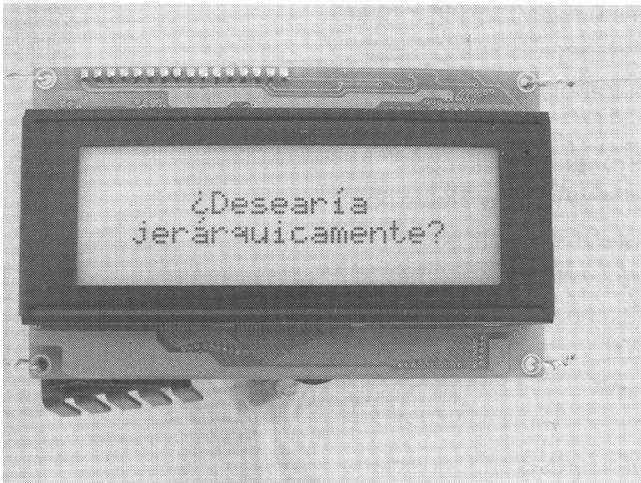
33 Questions Per Minute, Relational Architecture 5, Havana, Cuba. photo: Lozano-Hemmer, 2000

1. Some myths perpetuated by the TC [Technological Correctness] include that technology is: (1) providing a truly global culture; (2) introducing creative possibilities; (3) to be trusted with the management of resources both “natural” and “human;” and (4) eradicating discrimination on the basis of gender, race or class.