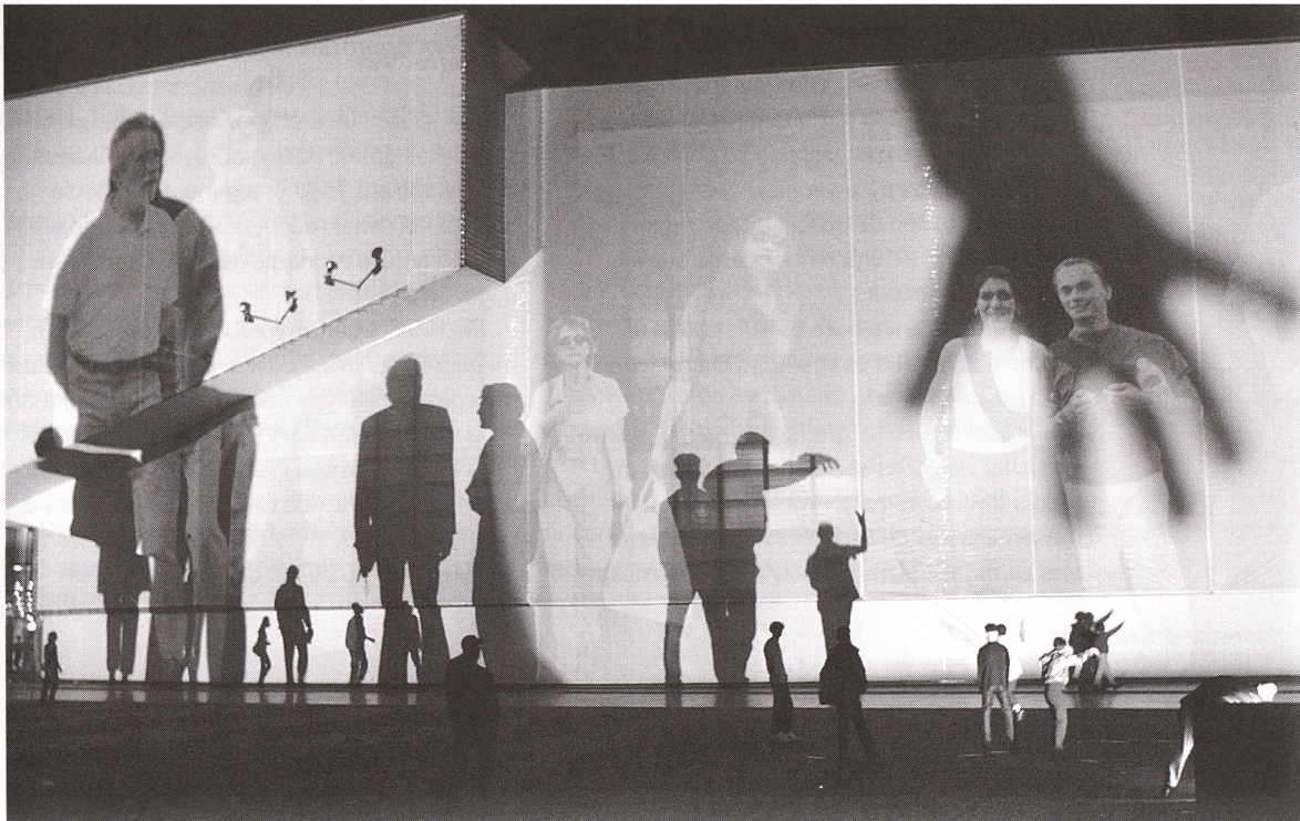
Body Movies, Arquitectura Relacional 6, Rotterdam, Holanda, Foto de Arie Kieuit

1. Algunos mitos perpetuados por la ideología de lo tecnológicamente correcto incluyen: 1) La tecnología está proporcionando una cultura verdaderamente global; 2) La tecnología está incorporando posibilidades creativas; 3) A la tecnología se le puede confiar la administración de los recursos tanto “naturales” como “humanos”; y 4) La tecnología está erradicando la discriminación por género, raza, o clase social. Leonardo , 29/1, 1996.