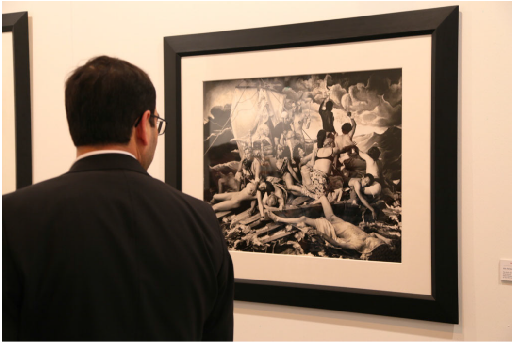
Joel-Peter Witkin.