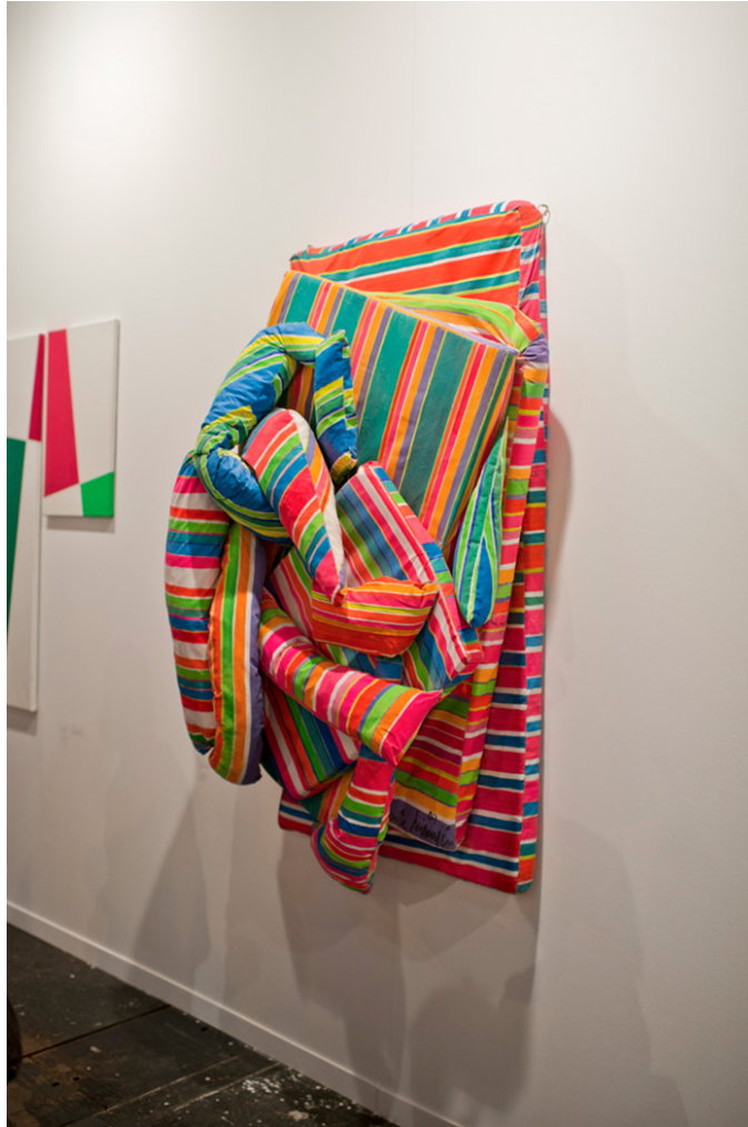
Marta Minujín.