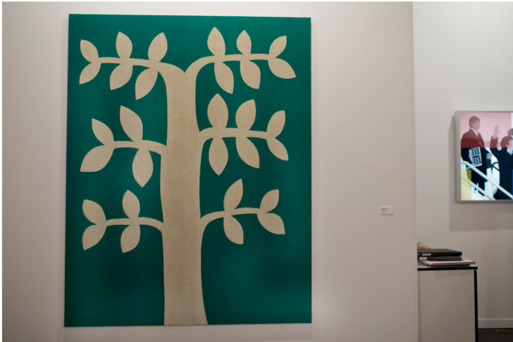
Obra de Antonio Ballester.