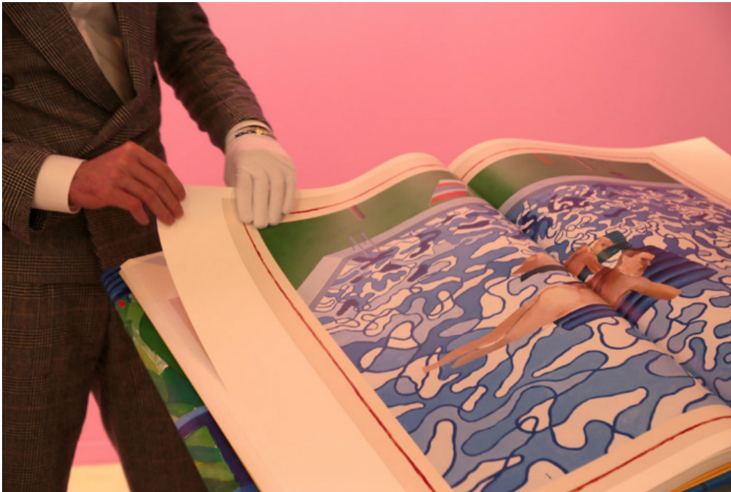
El libro gigante del stand de TASCHEN.

Aunque no es exactamente una obra, no hemos podido evitar pararnos ante el libro XXL dedicado a Hockney en el stand de TASCHEN.