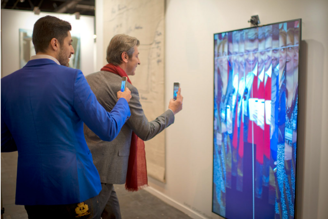
Rafael Lozano Hemmer.

En todas las ediciones hay piezas que consiguen gran atención mediática, hoy nos ha parecido que eso ocurría con la estupenda obra del artista Juan Hidalgo, Premio Nacional de artes plásticas, en ADORA CALVO. También con el vídeo interactivo de Rafael Lozano Hemmer en la pared exterior de MAX ESTRELLA.