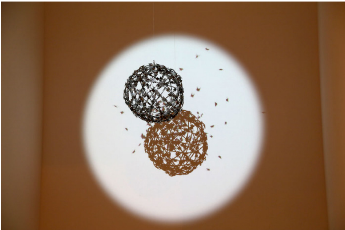
Una de las obras que se exponen en Opening.