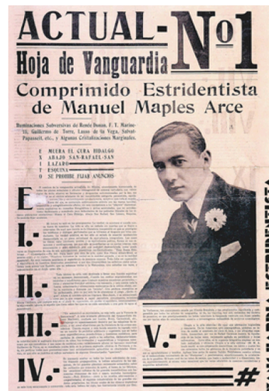
Manuel Maples Arce, Actual N°1 - Hoja de Vanguardia. Comprimido Estridentista, Manifeste stridentiste, 1921, Paris, Centre Pompidou, MNAM-CCI.

Avant tout littéraire, le stridentisme est un mouvement esthétique fondé en 1921 par le poète Manuel Maples Arce. Son nom fait référence à la stridence que son fondateur prétendait provoquer, mais aussi au bruit citadin et à la volonté de se faire entendre. Certains peintres, photographes et graphistes ont été séduits par ses propositions, inspirées des avant-gardes européennes comme le cubisme, le futurisme italien ou le mouvement Dada. Des stridentistes émane, à la fin des années 1920, le groupe ;30-30!, qui tient son nom de la carabine utilisée pendant la Révolution mexicaine de 1910 et adopte une position encore plus radicale. Ses membres ont notamment essayé de démocratiser l'art avec l'ouverture d'ateliers gratuits et l'enseignement de techniques accessibles au grand public, comme la gravure sur bois et l'illustration.